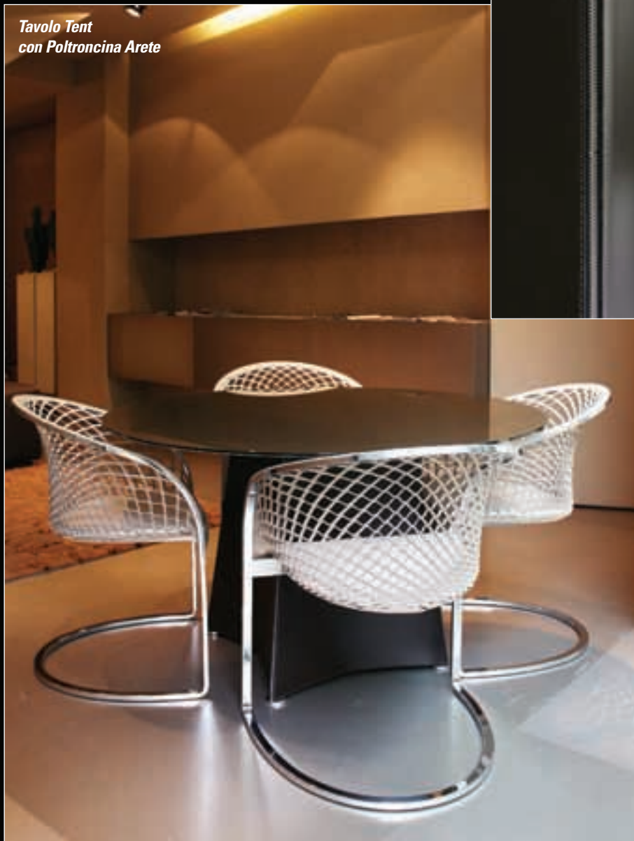
Tavolo Tent con Poltroncina Arete

to e slanciato al contempo coniuga una base centrale realizzata in cuoio ad un piano in cristallo - tondo o quadrato - color bronzo o fumè. Un tavolo che s'abbinava perfettamente alla poltroncina "ARETE" (Design: Franco Poli), realizzata in rete di cuoio con struttura in acciaio cromato. Dulcis in fundo il divano "ZIP COUNCH" , stile minimalista contraddistinto dalla particolare rifinitura a cerniera. Il massimo per chi ricerca il lusso e la particolarità dei dettagli, uniti al gusto del comfort nella sua dimensione più alta.